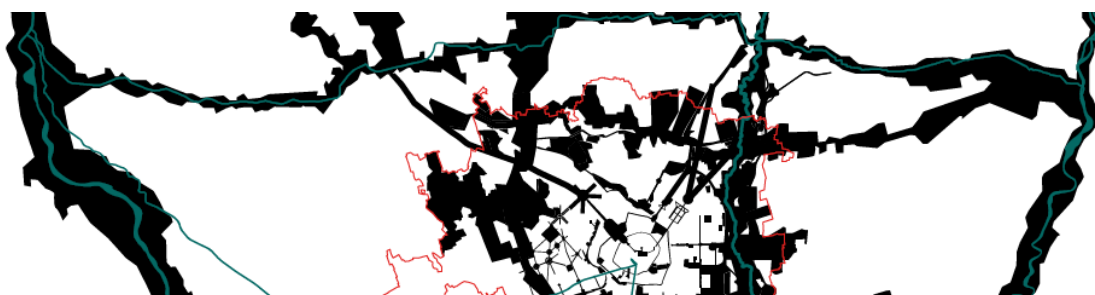
Rho come snodo della trama verde

Considerato il livello di urbanizzazione del contesto, il valore primario dell’area è da ricercare nel mantenimento e nella valorizzazione delle potenzialità presenti e degli spazi aperti rimasti , in grado di offrire ancora suggestioni paesaggistiche di un certo interesse, ma soprattutto di garantire un equilibrio ormai irrinunciabile tra edificazioni e spazi liberi . In tal senso il territorio di Rho l’area può contare su una dotazione di elementi qualificanti di tutto rispetto, sia nel settore dei parchi e delle aree protette, sia nei beni storico-ambientali, sia, infine, negli elementi legati alla fruizione del tempo libero.