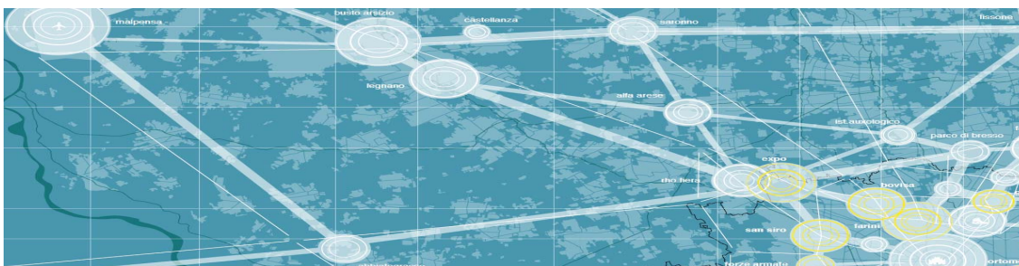
Rho come “epicentro” del sistema metropolitano

abbandona il carattere di “pausa” nella sequenza urbana per assumere un nuovo ruolo, di potenziale forte centralità.