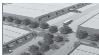
il sistema delle grandi trasformazioni; Fiera, EXPO2015 e le infrastrutture

Il nuovo fronte sul Sempione, ulteriormente rimarcato dai due alberghi in corso di realizzazione, e gli interventi di trasformazione che si affollano sul versante opposto della strada hanno colmato gran parte del vuoto che separava l’agglomerato nord di Pero dal centro di Rho, avviando la costruzione di una nuova continuità urbana.